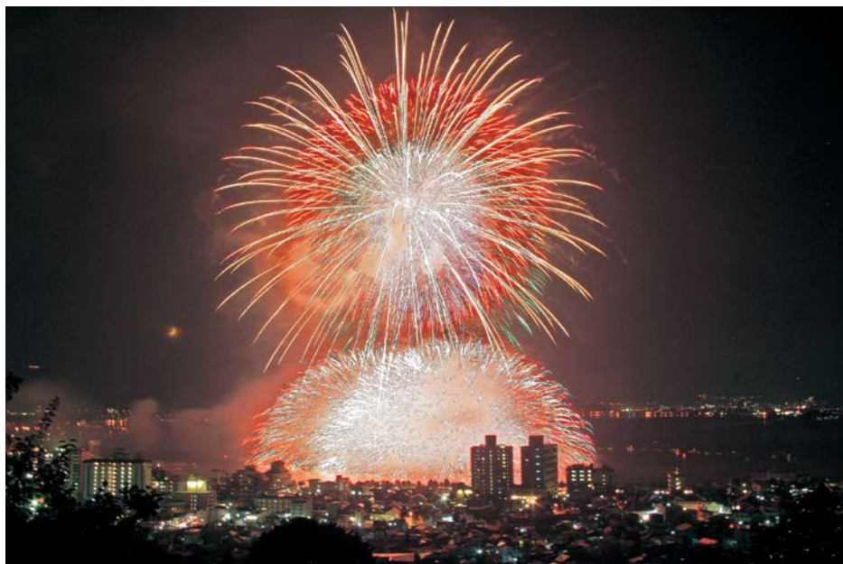
(立石公園より諏訪湖の花火)

※特売は2010年12月1日～2011年1月31日まで。 ※代理店よりお求めのお客様は販売店よりお求めください。